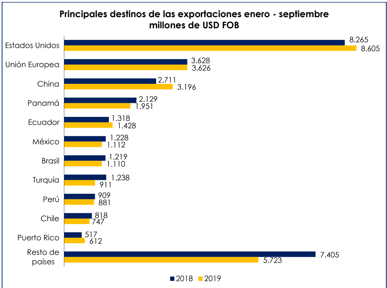
Gráfica 3.

En Latinoamérica se destacan como los principales destinos de las exportaciones a Panamá, Ecuador, México y Brasil, con variaciones a 2019 de -8,4%, 8,4%, -9,4% y -9,0% respectivamente en comparación al 2018. Esto demuestra que a excepción de Ecuador, las exportaciones a Latinoamérica han disminuido considerablemente.