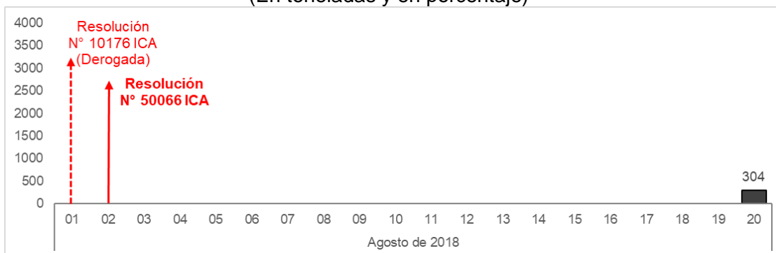
Gráfico N° 2 Perú: exportaciones diarias de café hacia el mercado colombiano (En toneladas y en porcentaje)

[99] Al revisar la evolución diaria de las exportaciones de café peruano a Colombia en el mes de agosto de 2019 se pudo constatar que, luego de expedirse la Resolución N°10176 y seguidamente la Resolución N° 50066 del ICA, tales exportaciones fueron nulas hasta el día 20 de agosto de 2019, fecha en la cual se observaron dos registros de exportación de café peruano hacia el mercado colombiano, uno por 202 toneladas y el otro por 102 toneladas, sumando un total de 304 toneladas.